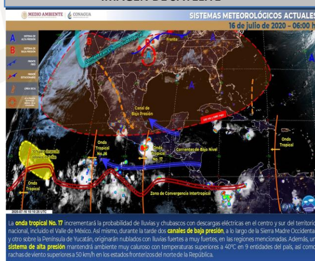
IMAGEN DE SATELITE

Cielo parcialmente nublado por la mañana, incremento de nublados por la tarde con chubascos y descargas eléctricas en Guanajuato, Querétaro, Hidalgo, Tlaxcala, Morelos y Puebla. Ambiente caluroso y viento de componente este de 10 a 25 km/h, además de rachas de 50 km/h en zonas de tormenta.